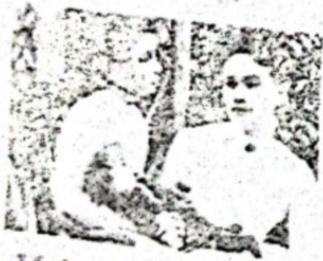
Helen Keller and Anne Sullivan at Cape Cod, 1888.